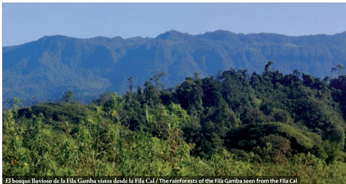
El bosque lluvioso de la Fila Gamba vistos desde la Fila Cal / The rainforests of the Fila Gamba seen from the Fila Cal

During the past few years, the establishment of 'biological corridors', which connect isolated forests or forest patches, has received great acceptance among experts. In initiatives such as the Mesoamerican Biological Corridor Project (MBS) numerous associations and institutions, such as NGOs and universities, cooperate in order to implement such biological corridors. The vision of this specific project is a green corridor