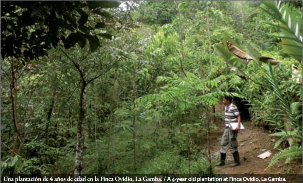
Una plantación de 4 años de edad en la Finca Ovidio, La Gamba. / A 4-year old plantation at Finca Ovidio, La Gamba.

los seres humanos, mamíferos, aves e insectos. Las heces de los animales atraídos pueden proveer una mayor variedad de semillas a las áreas en reforestación y así enriquecer la flora de manera natural. Otras especies preferidas son los árboles maderables utilizados por la gente de la localidad, por ejemplo, el Cristóbal ( Platymiscium curuense ) de la familia del frijol (Fabaceae), o el Manú ( Minquartia guianensis , Olacaceae). El Cristóbal se utiliza para la elaboración de muebles y el Manú, que es muy resistente a la putrefacción, se utiliza para la construcción de cercas. Es necesario señalar, que cada especie de árbol tiene diferentes necesidades ecológicas tales como la luz, nutrientes, textura del suelo, disponibilidad de agua, temperatura, etc. La selección adecuada de las especies para un sitio determinado es extremadamente importante para asegurar una alta supervivencia y las tasas crecimiento de las plántulas sembradas (véase la lista de especies en el apéndice).