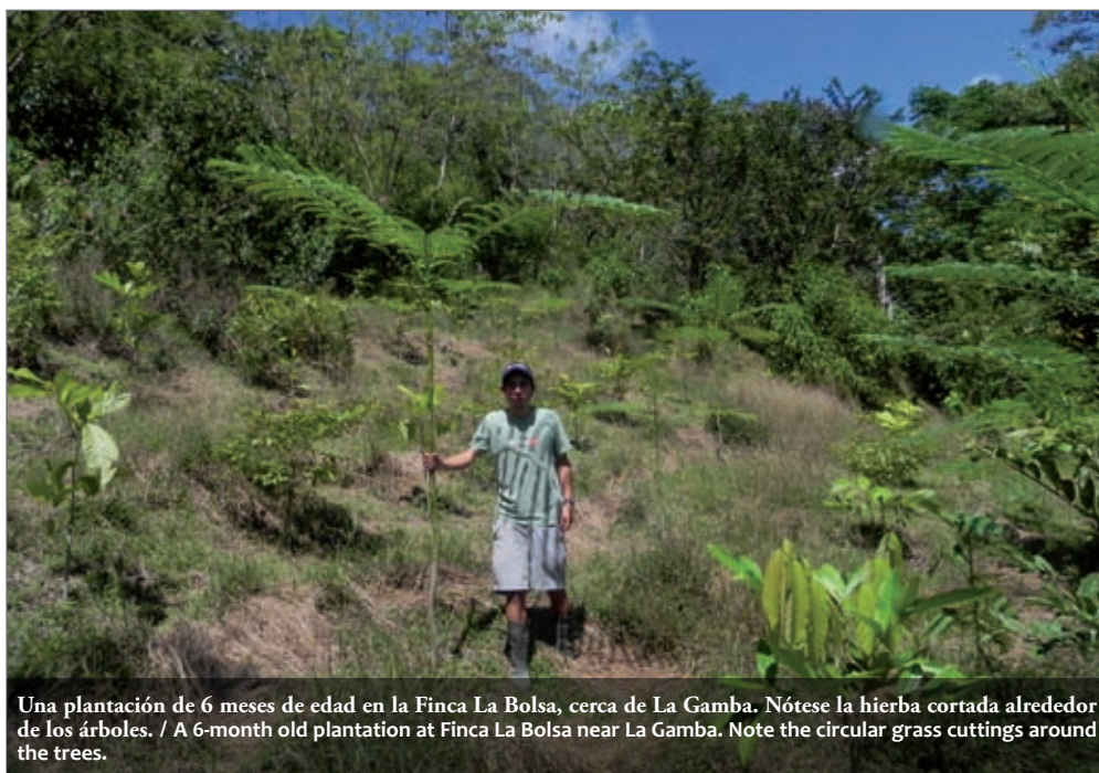
Una plantación de 6 meses de edad en la Finca La Bolsa, cerca de La Gamba. Nótese la hierba cortada alrededor de los árboles. / A 6-month old plantation at Finca La Bolsa near La Gamba. Note the circular grass cuttings around the trees.

In order to perform a selection of suitable species for a given location, it is necessary to know certain factors such as soil type (acidity, prior use, fertility, presence of compacted layers), weather conditions (precipitation) and topography, as well as the ecological characteristics of each species that is to be planted. Experience revealed how little information exists for most