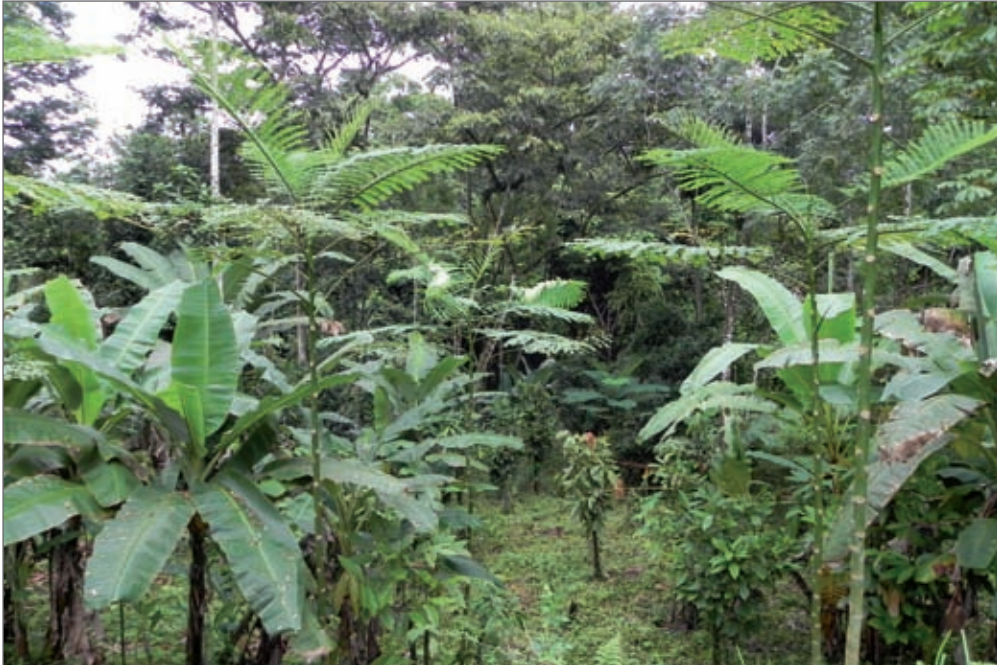
Los sistemas agroforestales consisten en una mezcla de árboles maderables y frutales, plátanos, verduras, etc. Estos benefician al pueblo y también ayudan a cerrar las brechas entre bosques cercanos y entre bosques aislados. / Agroforestry systems consisting of a mix of timber and fruit trees, bananas, vegetables etc. are beneficial to the people while equally helping to close forest gaps or to connect isolated forest patches.

altos niveles de acidez como el Mayo colorado ( Vochysia ferruginea , Vochysiaceae) y el Amarillón ( Terminalia amazonia , Combretaceae); y otras especies como el Iguano ( Dilodendron costarricense Sapindaceae) tienen su crecimiento limitado por condiciones de acidez.